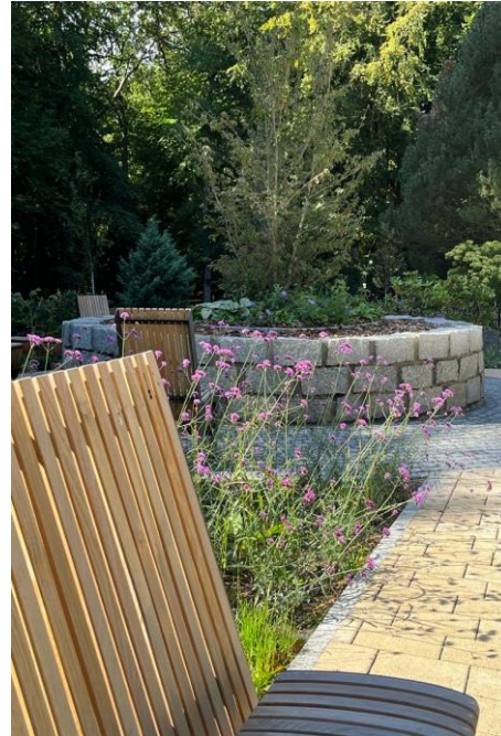
Bild: Friedhof nach der Maßnahme