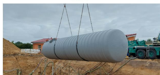
Abbildung 2 Lösschwassertank