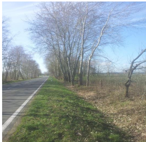
Abbildung 2 L07 mit Straßenrandflächen